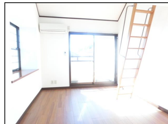
こちらの室内写真は207号室になります。