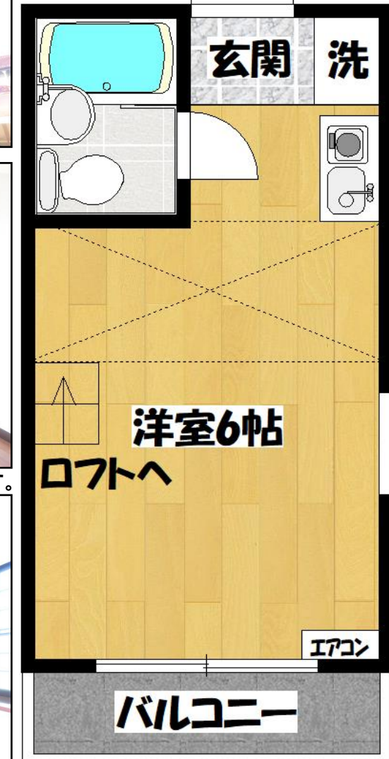
こちらの間取り図は207号室になります。102号室はクローゼット付。

★新入学生・新社会人の方、入居時期ご相談下さい!★ 図面と現況に相違いがある場合は、現況優先とします。